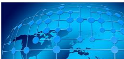
O współpracy zagranicznej