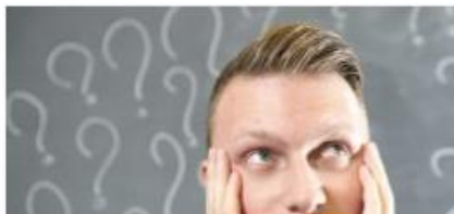
Mobilność: pytania i odpowiedzi