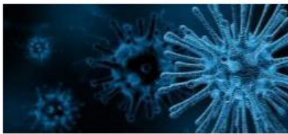
COVID-19 - aktualności